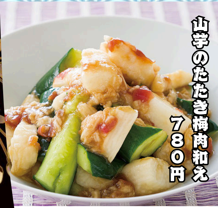
山芋のたたき梅肉和え 7800円