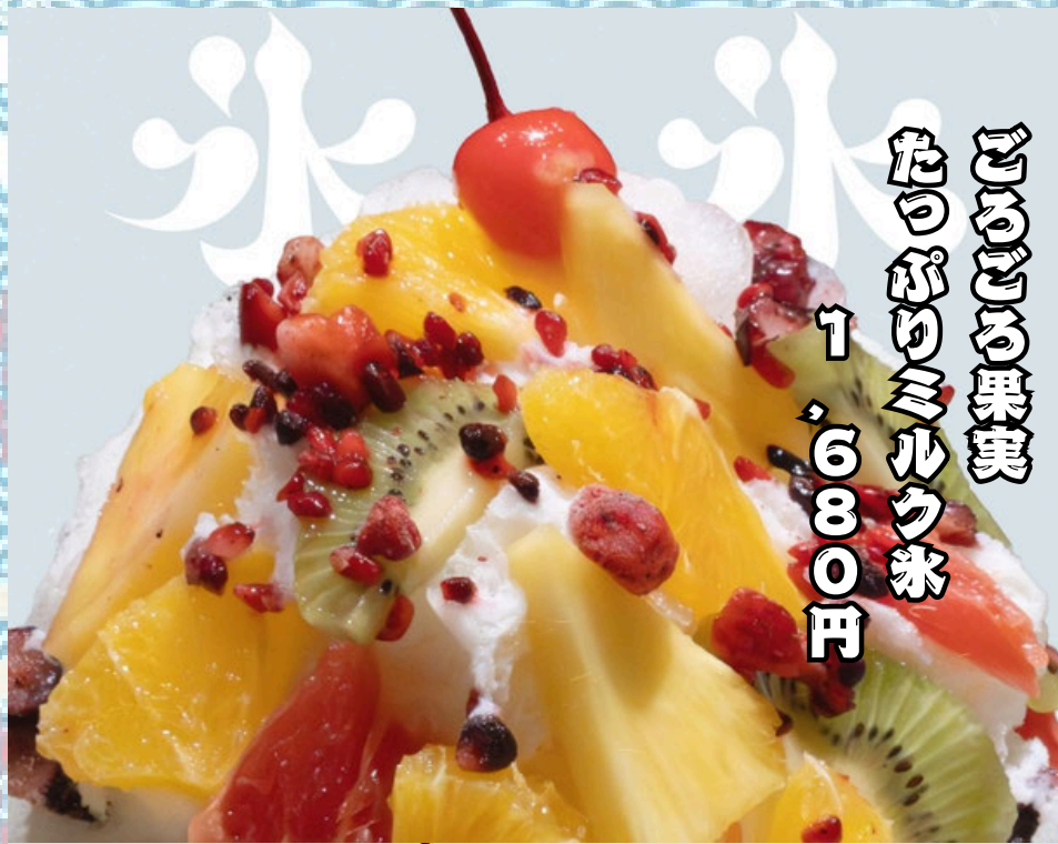
たろごごる果実 1980円