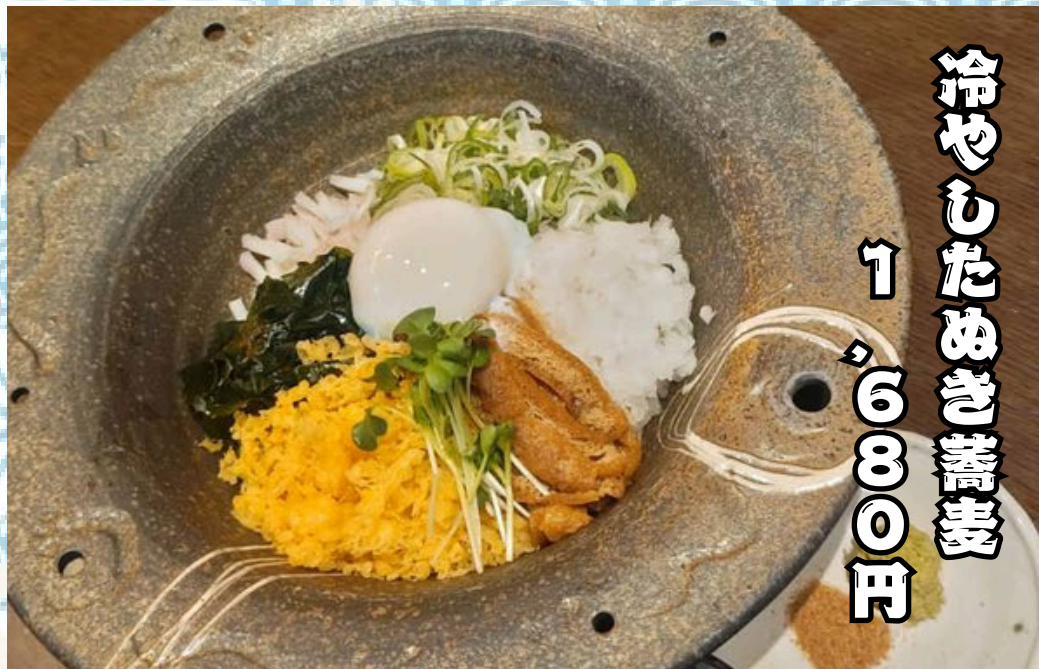
冷やしだれ蕎麦 1,600円