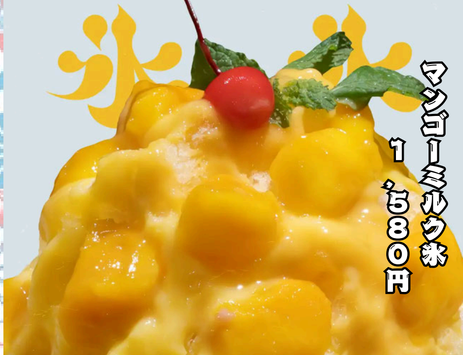
マンゴーミルク 1980円