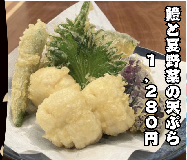
鱧と夏野菜の天ぷら 1、2800円