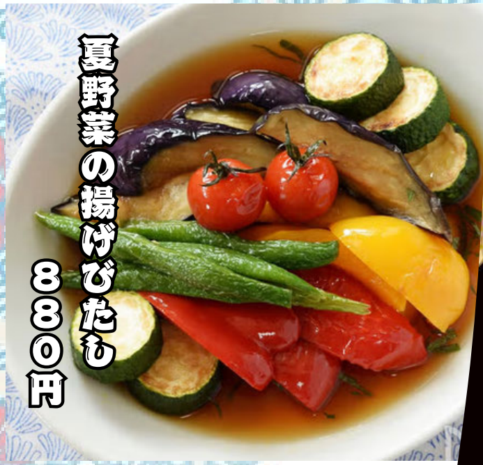
夏野菜の揚げびたも 8000円