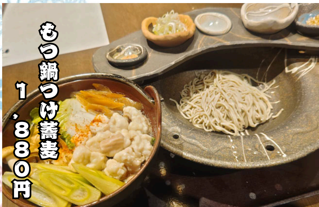
もり鍋つけ蕎麦 1,800円