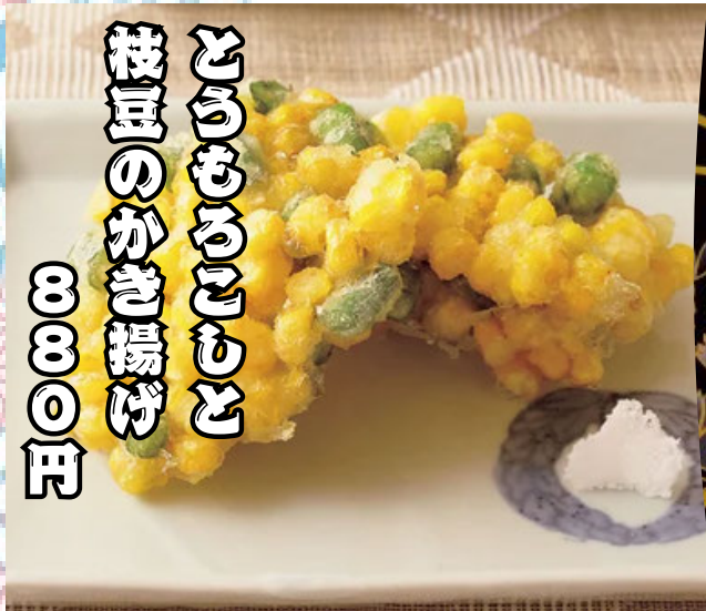
むらさきいんげん 枝豆のかき揚げ 8000円