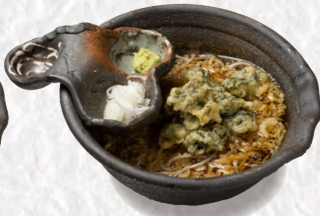
あおさのり狸 1300円(税込)