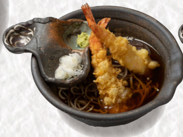
海老天そば 1300円(税込)