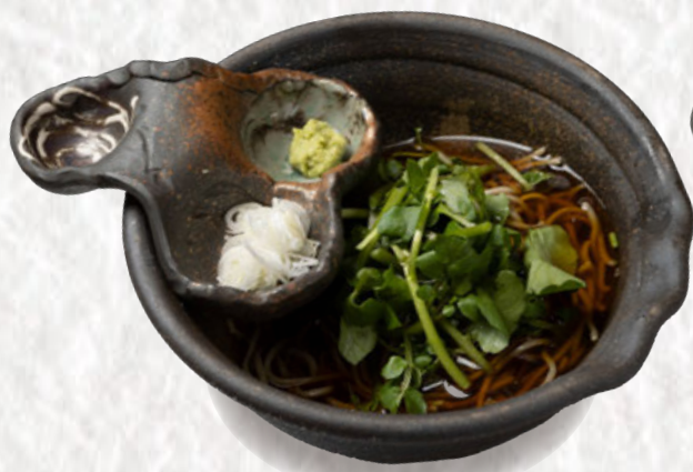
クレソンそば 1300円(税込)

三重県いなべの契約農家から直接届く、 「朝採れクレソン」を使用。 わさびに近い辛みがあり癖になる一品。