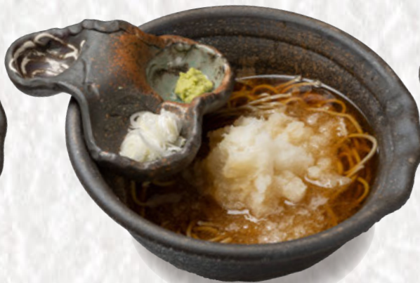
鬼おろしそば 1300円(税込)

三重県いなべの契約農家から直接届く、 「朝採れクレソン」を使用。 わさびに近い辛みがあり癖になる一品。