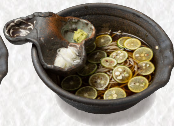
すだちそば 1300円(税込)